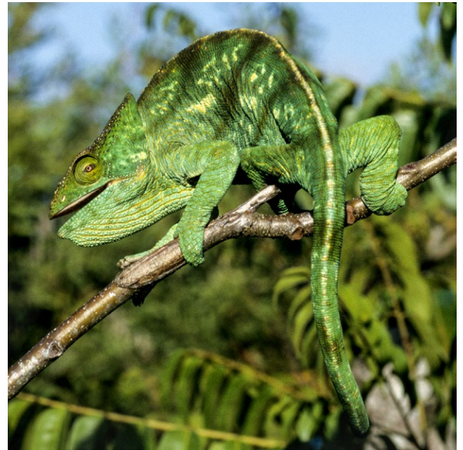
Caméléon de Parson femelle.

il l'attrape avec la pointe musclée de sa grande langue couverte de salive gluante. Sa rapidité et sa précision d'exécution font qu'il ne rate jamais sa cible. Un adulte mange de 20 à 30 insectes par jour et n'hésite pas à s'attaquer aux araignées bien plus grandes que sa bouche, parfois même à de petits invertébrés. Il chasse de jour, la plupart de son temps dans les arbres, à l'abri d'éventuels prédateurs : serpents, mammifères carnassiers et oiseaux de proie. Victime de son succès commercial et de la déforestation, ce reptile est inscrit en annexe II de la CITES. Actuellement, il n'est donc pas nécessairement menacé d'extinction, mais pourrait le devenir si son commerce n'était pas étroitement contrôlé.