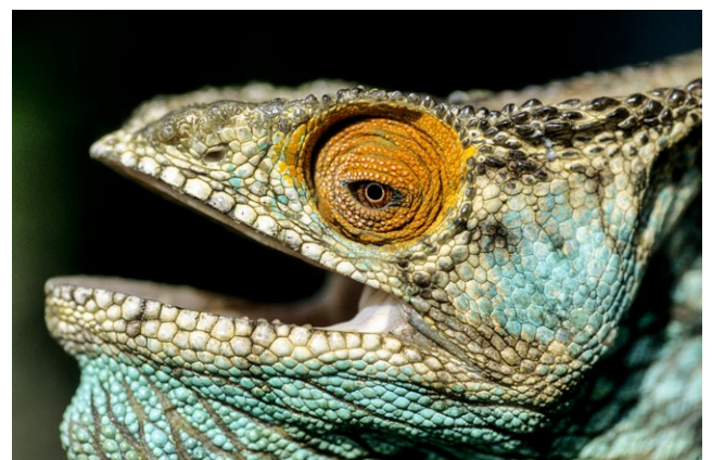
Le caméléon de Parson (Chamaeleo parsonii) de Madagascar est le plus grand de la planète.

la fixe des deux yeux afin d'obtenir une image stéréoscopique qui lui donne une parfaite estimation de sa distance. À l'image d'une ventouse,