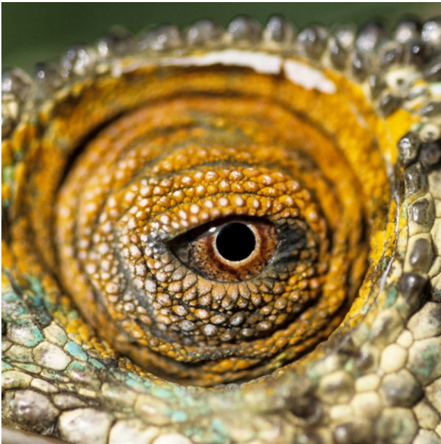
Détail de l'œil du caméléon de Parson.